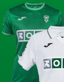
dresy 24/25 Tipsport